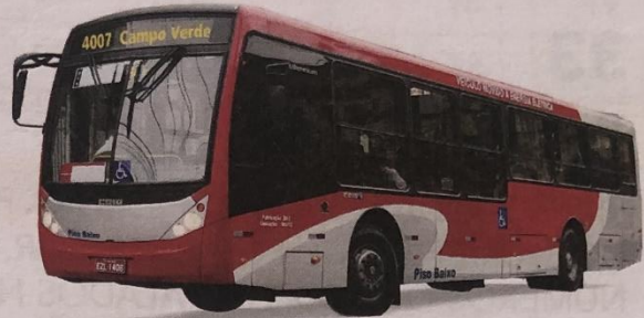
LINHA 4007 – CAMPO VERDE