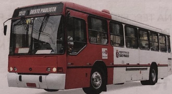
LINHA 1212 – OESTE PAULISTA