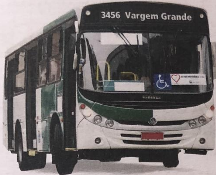
LINHA 3456 – VARGEM GRANDE

1. A CIDADE DE SÃO PAULO POSSUI VÁRIAS EMPRESAS DE ÔNIBUS URBANO. OBSERVE AS ILUSTRAÇÕES. LEIA EM VOZ ALTA OS NÚMEROS QUE IDENTIFICAM CADA LINHA DE ÔNIBUS.