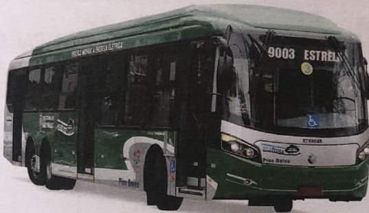
LINHA 9003 – ESTRELA